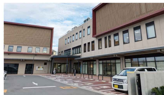
地域住民の一番身近な施設を目指す